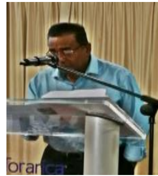
CEO Boedjawan tijdens de VES CEO Talk in oktober 2016

Deze waren bijzonder goed bezocht en hebben levendige discussies opgeleverd.