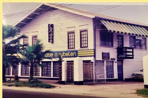
Locatie Fabriek (foto jaren 80)