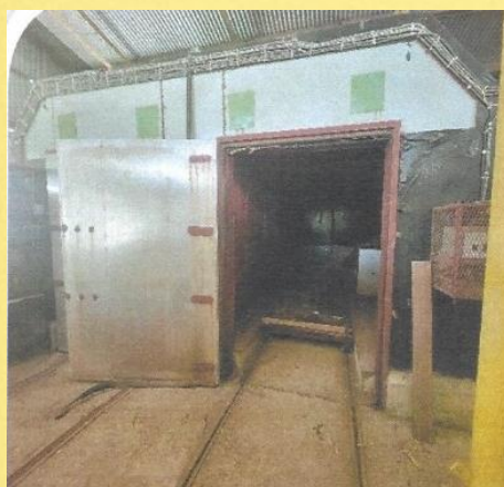
Eerste droogkamers (2005)

Randoe bleef vasthouden aan het leveren van kwaliteit en kreeg, mede door de digitalisering met "Grote Beer" IT-pakketten en ISO-certificering, inzicht in financiële- en voorraaddata-analyse. Automatisering zorgde ervoor dat we veel beter wisten waar de kosten lagen en dat er een veel efficiëntere productiemethode kon worden ontwikkeld met behulp van computers. Het analyseren van uren en kosten resulteerde er al snel in dat met 35 man dezelfde omzetten werden behaald als vroeger met 80 man. Ondanks het inzicht en de inkrimping was Randoe in 2002 toch genoodzaakt om de winkellocatie aan de Zwartenhovenbrugstraat te verkopen en de showroom te verhuizen naar de Dr. Sophie Redmondstraat.