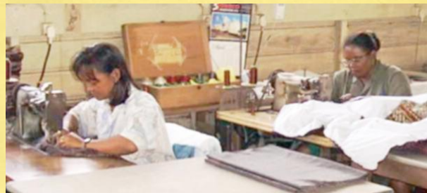
Stiksters in de stoffeerderij (jaren 80/90)

Randoe kon door zijn kleinschaligheid nog via de bedrijven aan de kustvlakte aan hout komen, maar heeft ook bijna 6 maanden niet geproduceerd door de ontwikkelingen in het land. Sindsdien wordt multiplex, spaanplaat en andere bouwplaatsoorten geïmporteerd voor de lokale markt. Ondanks deze uitdagingen bleef Randoe meubels maken van lokaal hout en geïmporteerde rotan. In de jaren '85 en '86 begon Randoe te experimenteren met export naar Curaçao en Aruba. Dit werd gestimuleerd doordat de regering van Curaçao op zoek was naar 'on-the-job' trainingen. In de wijk Saliña werd een fabriek opgezet met lokale werknemers, ondersteund door personeel van Randoe. Vanuit deze fabriek werden producten geëxporteerd naar Aruba, waaronder rotan, houten en gestoffeerd meubilair. Uiteindelijk stopte deze samenwerking eind jaren '80, vanwege de te hoge kosten. Halverwege de jaren '90 werd de Caricommarkt geopend en werd het importeren van goederen naar Suriname vergemakkelijkt. De heffingen gingen omlaag en de lokale productie moest zich aanpassen aan de markt. Veel productiebedrijven kwamen ook toen in problemen. De rotanproductie werd stopgezet omdat lokaal produceren niet kon concurreren met de massaproductie uit Indonesië en de vele goedkopere 'plastic' rotan uit China. Reparatie werk van Rotan bleef Randoe wel doen. Van de hoogtijdagen met 80 man personeel ging Randoe terug naar 50 man, maar wel met behoud van kennis en expertise.