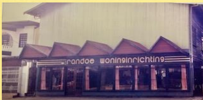
Winkel aan de Zwartenhovenbrugstraat (foto jaren 80)

Een kritisch punt bleek de afhankelijkheid van de houtconcessies van Bruynzeel, Wijma en kleine, in de kustvlakte opererende lokale zagerijen, vaak allemaal met vooroorlogse machines uit de jaren '30 en '40. Niet alleen voor Randoe, maar ook voor de bedrijven die multiplex en spaanplaat produceerde. Door de situatie in het land vertrok veel expertise en werd de productie van multiplex, mix-o-plex en spaanplaat zowat geheel stilgelegd. Kort daarna werd bijna alle houtvoorziening door de binnenlandse oorlog in de bosconcessies stilgelegd. Het was het einde voor Bruynzeel, Wijma en bijna alle houtexport met kennis en expertise.