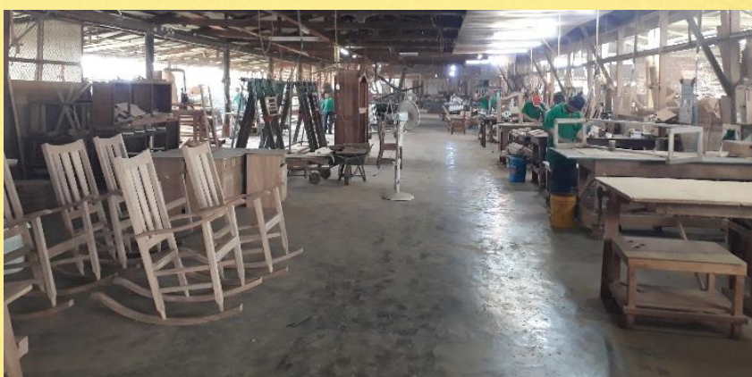
Montage afdeling fabriek (2019)